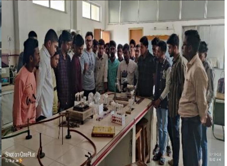
Educational Tour Photo