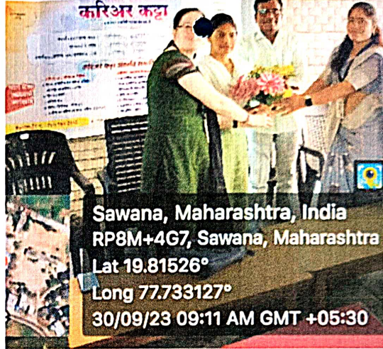
Sawana, Maharashtra, India RP8M+4G7, Sawana, Maharashtra Lat 19.81526° Long 77.733127° 30/09/23 09:11 AM GMT +05:30