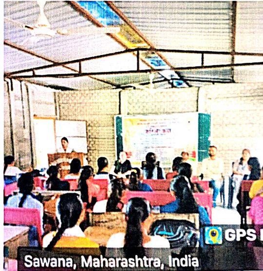
Sawana, Maharashtra, India

Principal Shri Vitthal Rukmini Arts, Comm. & Science College Sawana Rd, Maharashtra