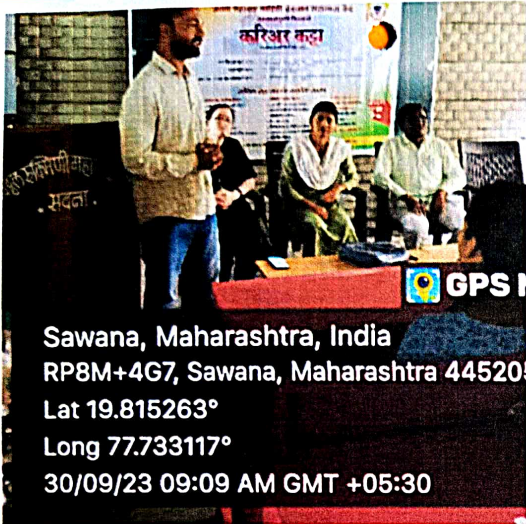
Sawana, Maharashtra, India RP8M+4G7, Sawana, Maharashtra 44520 Lat 19.815263° Long 77.733117° 30/09/23 09:09 AM GMT +05:30