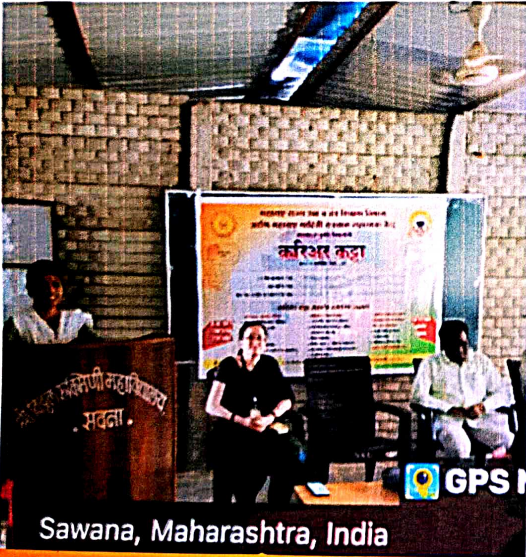
Sawana, Maharashtra, India